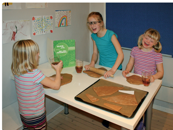
Fig. 137 Arbeidsmiljøfremmende tiltak virker. Her er det ingen ting å si på stemningen.

byggverket. Brannfaren er spesielt stor dersom man bruker brennbart materiale som for eksempel bomull (snø) og granbarkvister (trær) rundt byggverket.