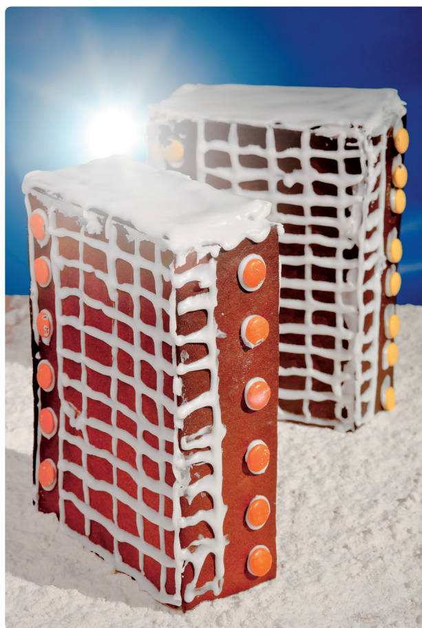
Fig. 52 b

[645]