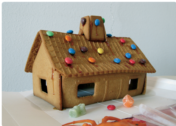
Fig. 153 Eksempel på byggskader som følge av bygging i for varmt og fuktig klima. Konstruksjonsdeler har begynt å sige, og byggverket løsner i sammenføyningene.