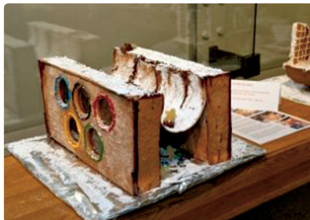
Fig. 52 a