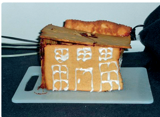
Fig. 52 f Organisk pragmatisme Fra VGs pepperkakehuskonkurranse 2009, VG-nett