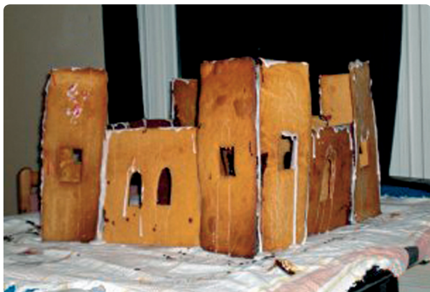
Fig. 52 h