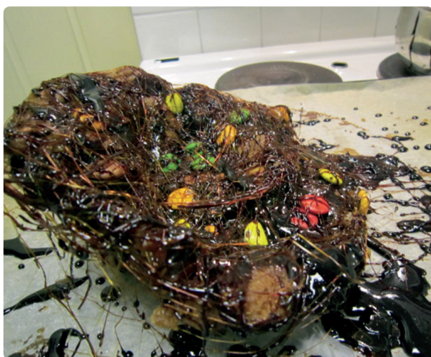
Fig. 52 d Ekspresjonisme / action painting Privat blogg