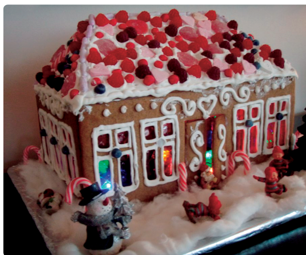
Fig. 52 g Postmoderne klassisisme Fra VGs pepperkakehuskonkurranse 2009, VG-nett