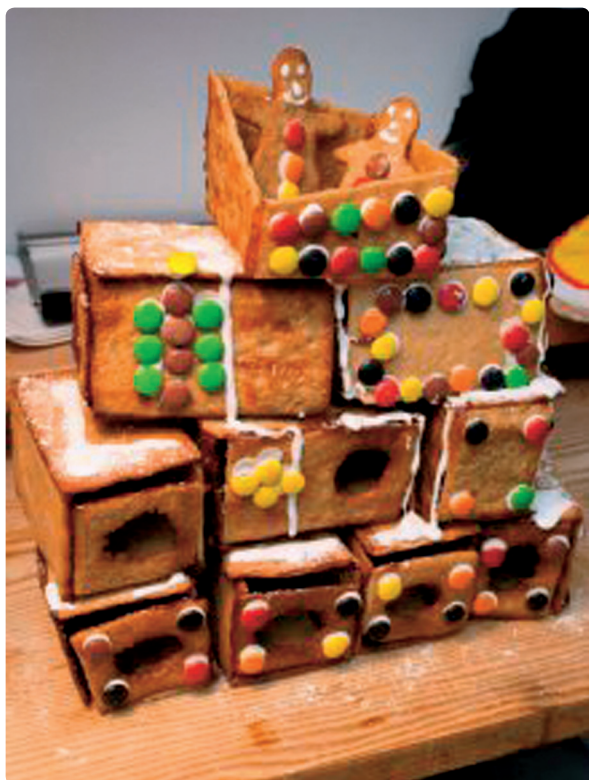
Fig. 52 c Strukturalisme Fra VGs pepperkakehuskonkurranse 2009, VG-nett