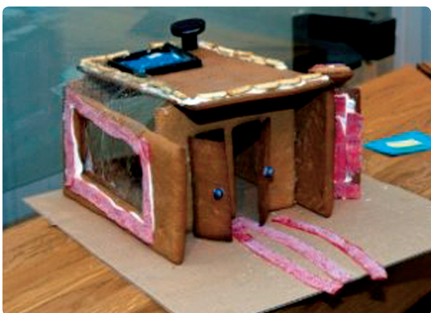
Fig. 52 i

Fra VGs pepperkakehuskonkurranse 2009, VG-nett