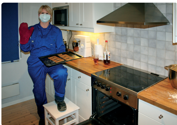
Fig. 135 Tenk sikkerhet. Bruk verneutstyr ved steking.