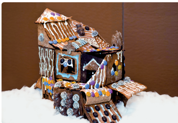
Fig. 52 e Additiv konstruktivisme [646]